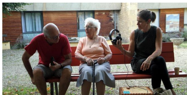
Image 2 Projet Qu'est-ce que tu fabriques ? à Saint-Macaire

Développer des actions en matière de prévention des chutes pour les seniors à domicile et les résidents en EHPAD ( exemples : ateliers réalisés par des ergothérapeutes, psychomotriciens, éducateurs en activité physique adaptée ... ) ; développer des solutions et dispositifs permettant la mobilité seniors vivant à domicile ; développer des actions concernant la sécurité routière ou des déplacements (véhicules, vélo, piétons) et leur apprentissage ou réapprentissage