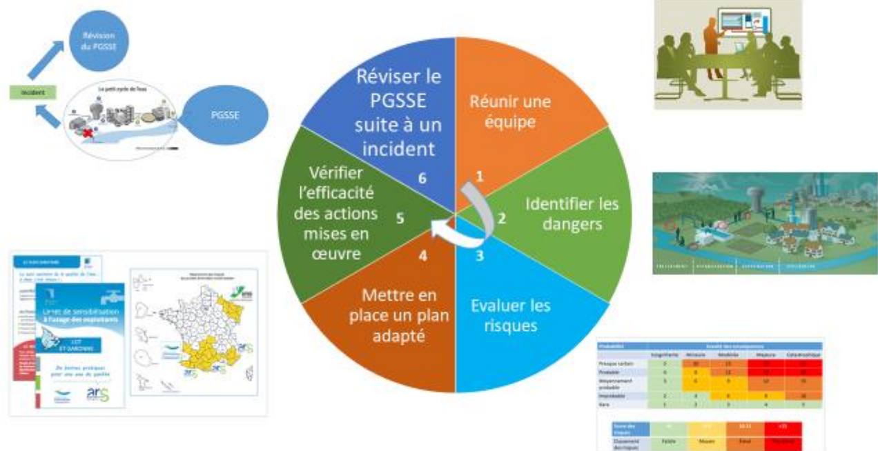
Figure 1 : Les 6 étapes de la démarche PGSSE