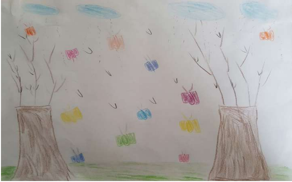
Il pleut des cadeaux GEM Espoir de la vie