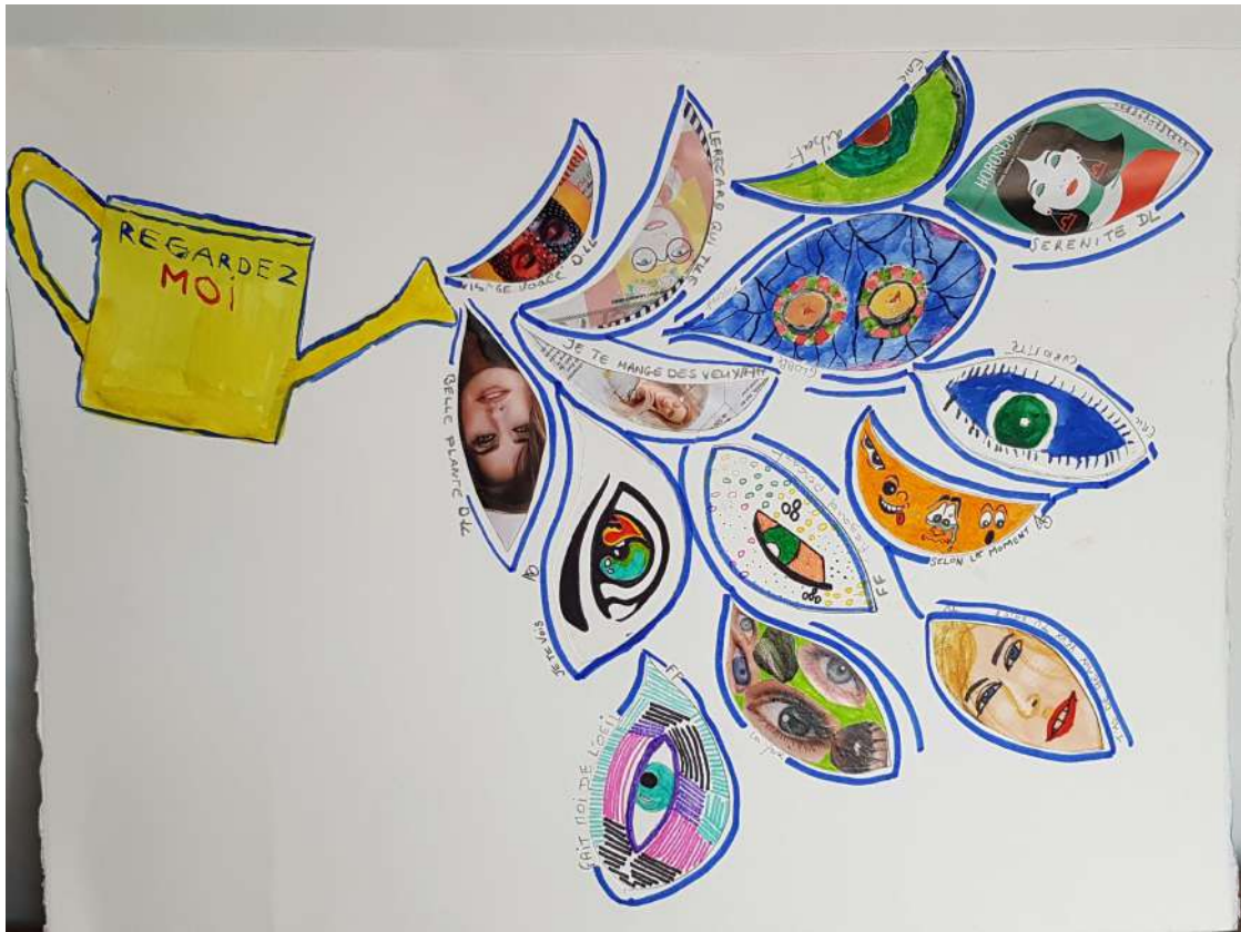
Regardez -moi CEID Communauté du Fleuve