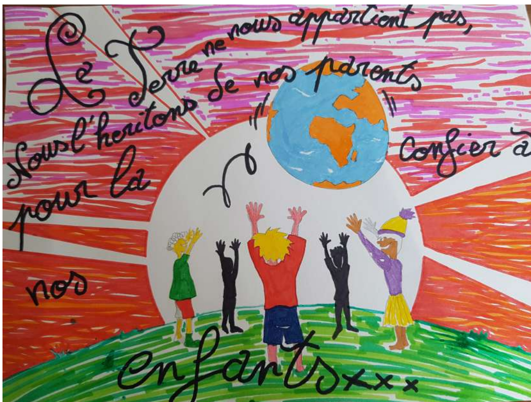
Dessin GEM L'Entre-Temps