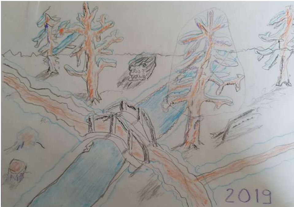
Le petit pont GEM Espoir de la vie