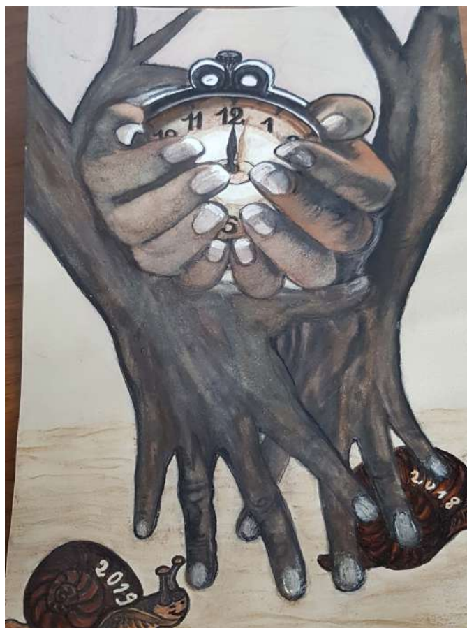
Ainsi va la vie GEM Métamorphose