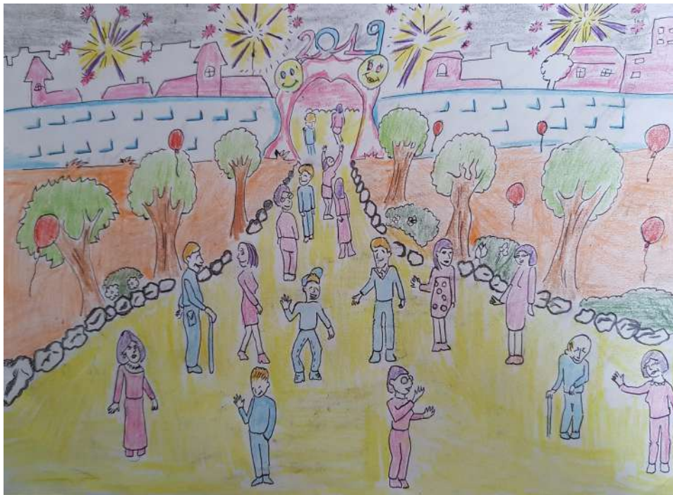
En route pour de nouveaux jours GEM Suis ton ch'min