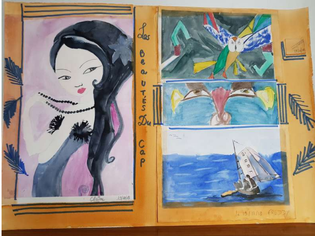
Les beautés du Cap CEID Communauté du Fleuve