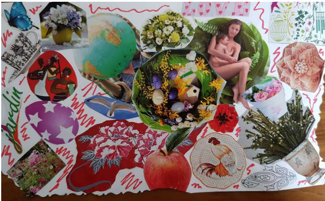
La vie en couleurs GEM le Kiosque 12