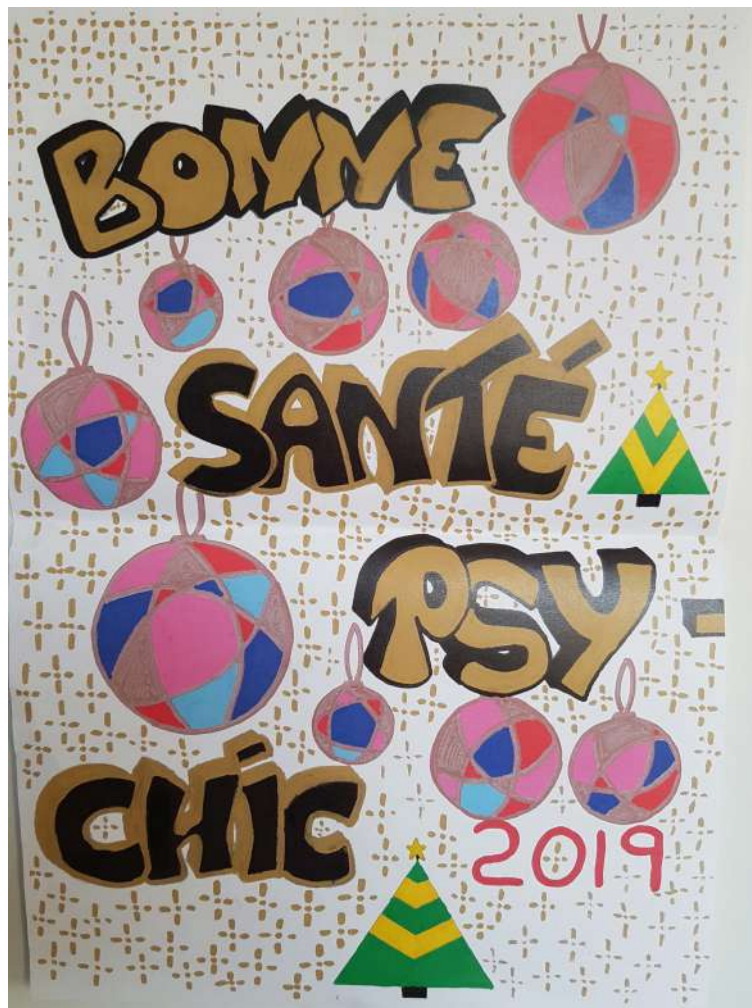
Une santé psy-chic GEM Phoenix