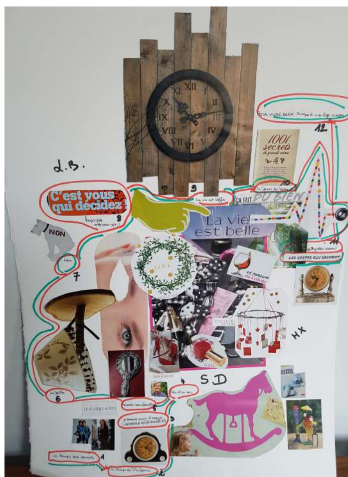
Temps croisé CEID de Bègles