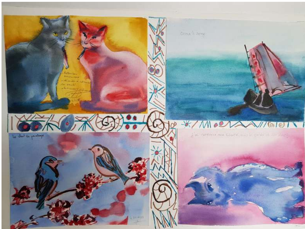
Se mettre à l'endroit CEID de Bègles