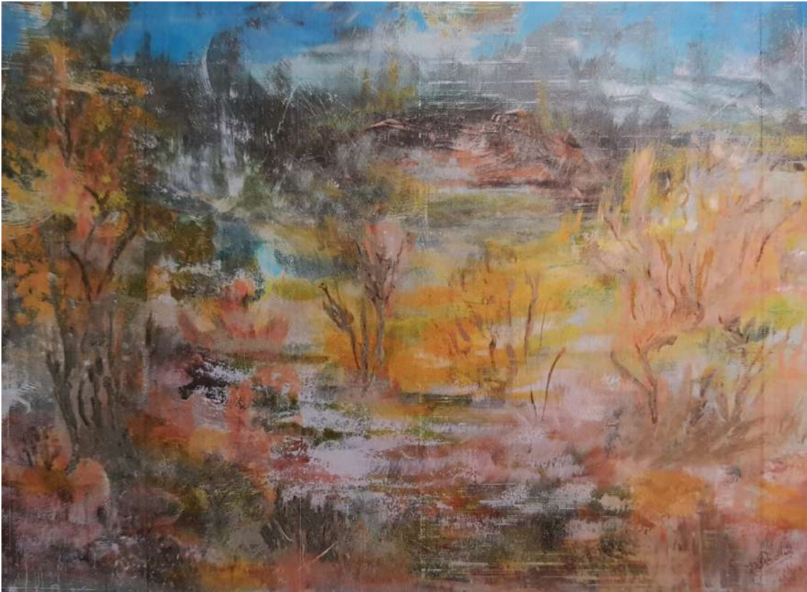
Nuit d'été GEM le Kiosque 12