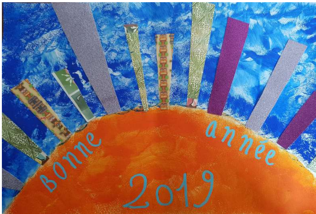
Une année ensoleillée GEM Phoenix