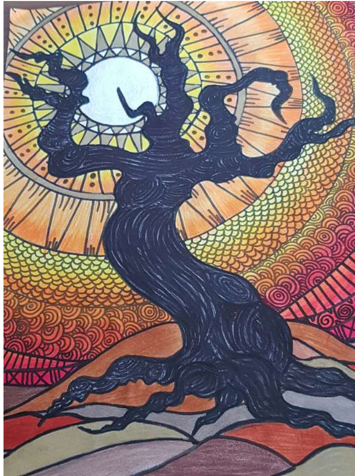
Renaissance GEM Métamorphose