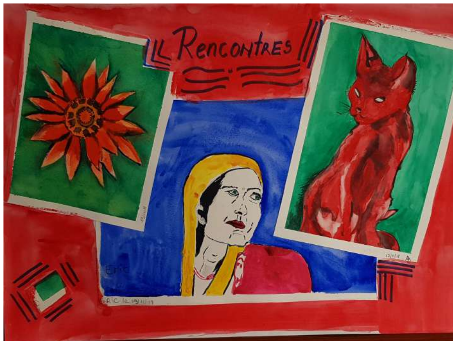
Rencontres CEID Communauté du Fleuve