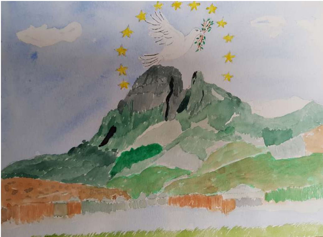
Aquarelle GEM L'Entre-Temps