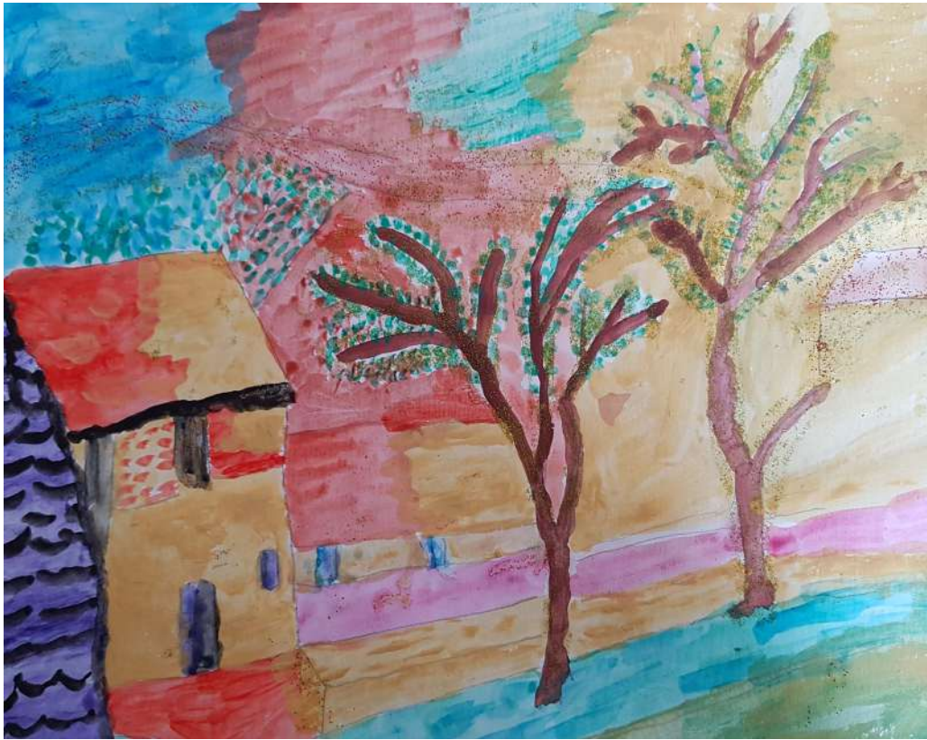
Des étoiles dans le vent GEM Espoir de la vie