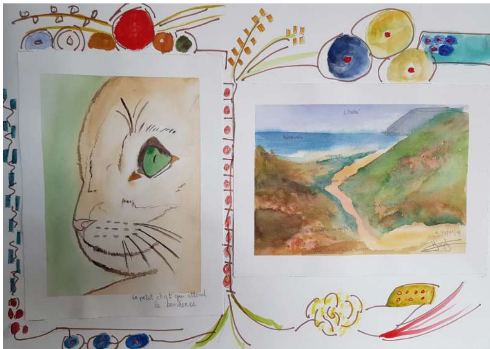
Retrouver la bonne route CEID de Bègles