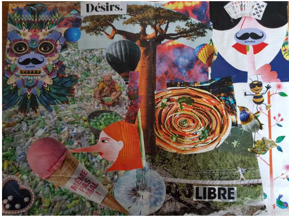
Collage GEM L'Entre-Temps